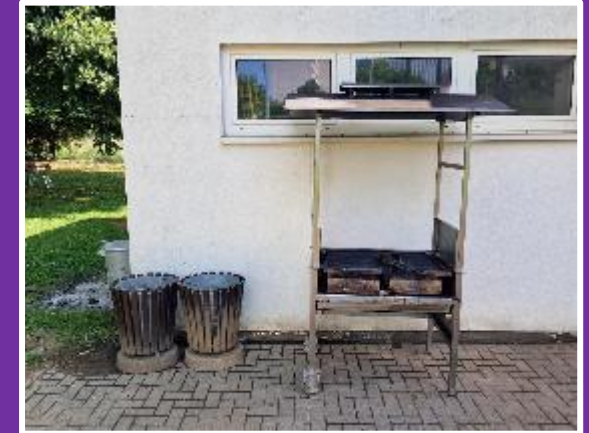
Grillwagen mit Grillrost (80x60cm)

Bitte Festzeltgarnituren & Stehtische, wie auf Bild zu sehen stapeln. Nachträgliche Räumarbeiten werden mit 50€/Stunde berechnet.