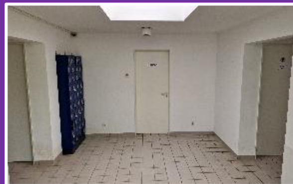
Vorraum Toiletten, links Damen, rechte Herren, Toiletten identisch