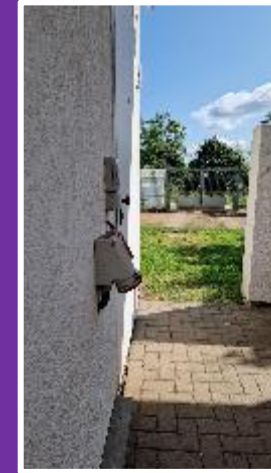
Entfernung zum 3m