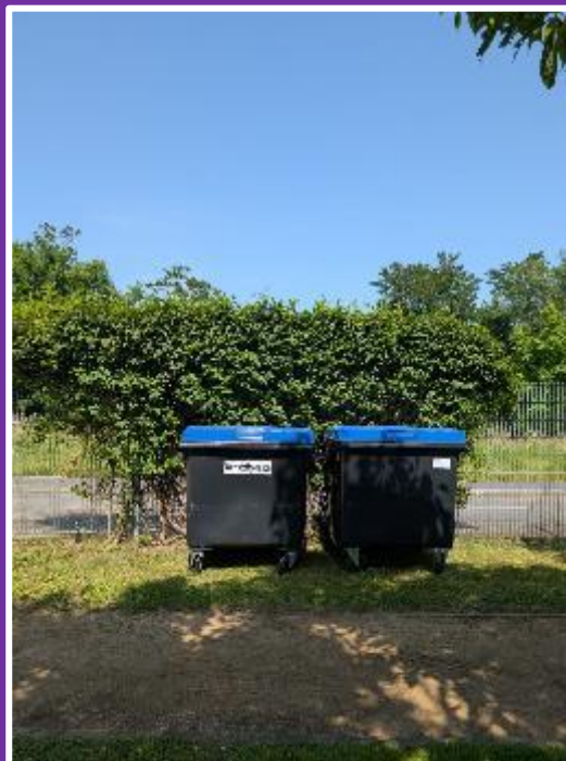
Einbringen von heißen Gegenständen ist strengstens verboten.

Das Einbringen von heißen Gegenständen in alle Mülleimer & Mülltonnen auf dem Gelände des Sportzentrums ist strengstens untersagt. Der Mieter ist für den gewissenhaften Umgang mit Gefahrenquellen wie heißen Gegenständen, heißer Asche, Glasscherben etc. selbst verantwortlich und haftet, für alle durch ihn verursachte Schäden.