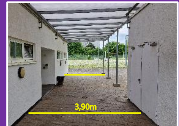
Überdachte Fläche / ca. 70m 2