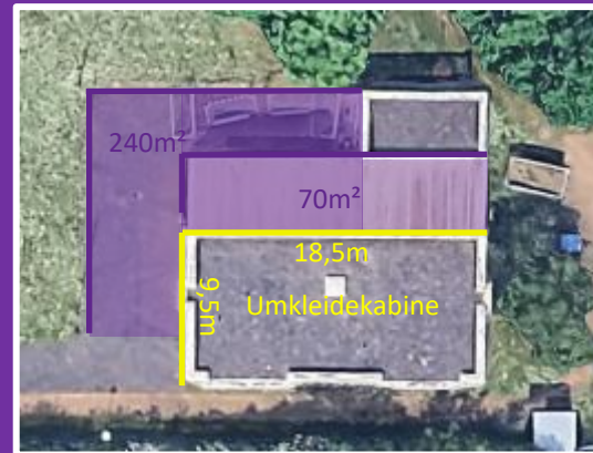
Ca. 240m 2 / davon 70m 2 überdacht