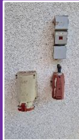
1 x CEE-63A, 1 x CEE-32A, 1 x 230V