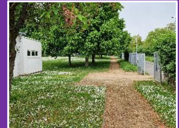
Anlieferfläche des Grillplatzes, Stellplatz Foodtruck