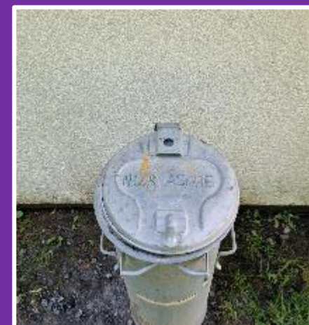
Aschetonne zum Einfüllen der Asche,