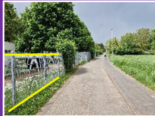
Zaun kann an dieser Stelle geöffnet werden