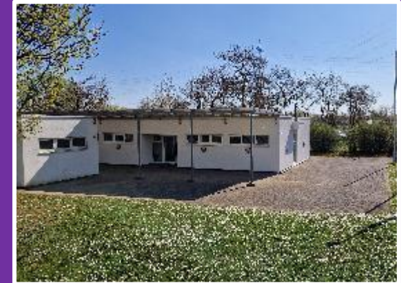
Blick von Sommerwiese auf Grillplatz